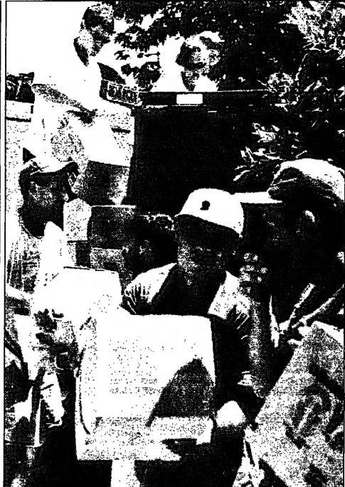
جنود امريكيون ياتون لمساعدة الجرحى في كندا يقبلون مساهمات مختصة لجنودهم الانزال

في مدينتشو، تجمع من اجل السلام صوماليين، اذ قتل مصور صومالي في مدينتشو، تجمع من اجل السلام صوماليين.